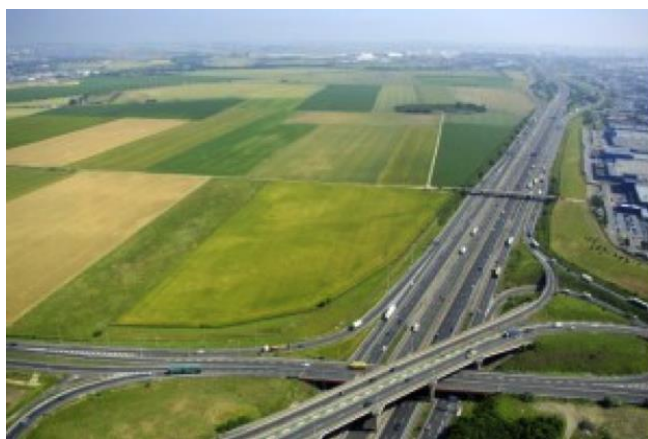
Les terres agricoles du Triangle de Gonesse

De même, après audition à la Région de nombreux acteurs concernés, notamment les représentants du groupe Immochan porteur du projet, des représentants des entrepreneurs locaux, de l'Autorité environnementale, mais aussi plusieurs associations environnementales et citoyennes, et des experts de l'Institut d'Aménagement et d'Urbanisme (IAU), il s'est avéré que les arguments en défaveur du projet Europacity étaient particulièrement forts concernant les risques économiques, sociaux et environnementaux engendrés par de projet. Des risques sur lesquels les promoteurs du projet n'ont pas su répondre de façon satisfaisante allant jusqu'à déstabiliser des défenseurs du projet.