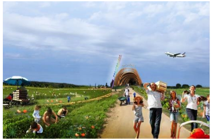
perspective « Fort Gonesse » équipe Castro-Denissof-Casi pour l'AIGP