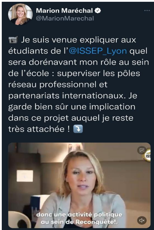
Tweet de Marion Maréchal publié le 16 mai 2022 à 17h30